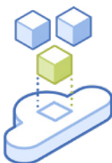
Elasticidade sob demanda

Expanda recursos de nuvens privadas para nuvens públicas em minutos