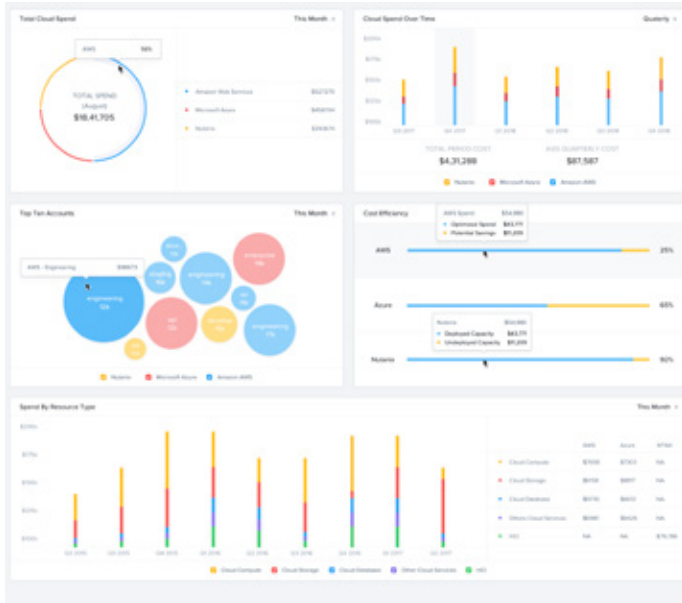
Governance dei costi multi-cloud

Con Beam puoi visualizzare i consumi cloud sia per i cloud pubblici che per quelli privati e applicare direttamente le policy che migliorano la sicurezza e controllano i costi, il tutto da un unico pannello. Beam è lo strumento di governance multi-cloud completo per l'intero ambiente cloud.